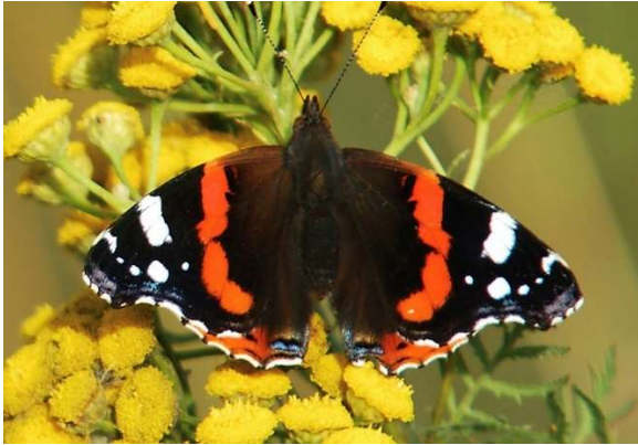
Amiraali © Arto Lehtinen