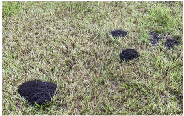
Kontiaisen kekoja

Vuoden 2024 projektilajit ovat amiraali ja kontiainen eli vanhalla nimellä maamyyrä. Näistä tarkemmin vuoden 2024 tiedotteessa 1.