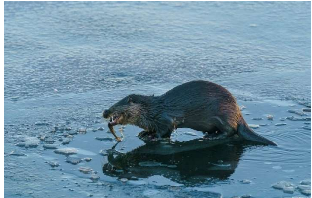
Saukko ruokailemassa.

Ympäristöyhdistys on valinnut vuoden 2023 projektilajeiksi pähkinähakin ja saukon. Havainnot kerätään koko vuodelta, joskin sulan maan aikana lajia näkee harvoin