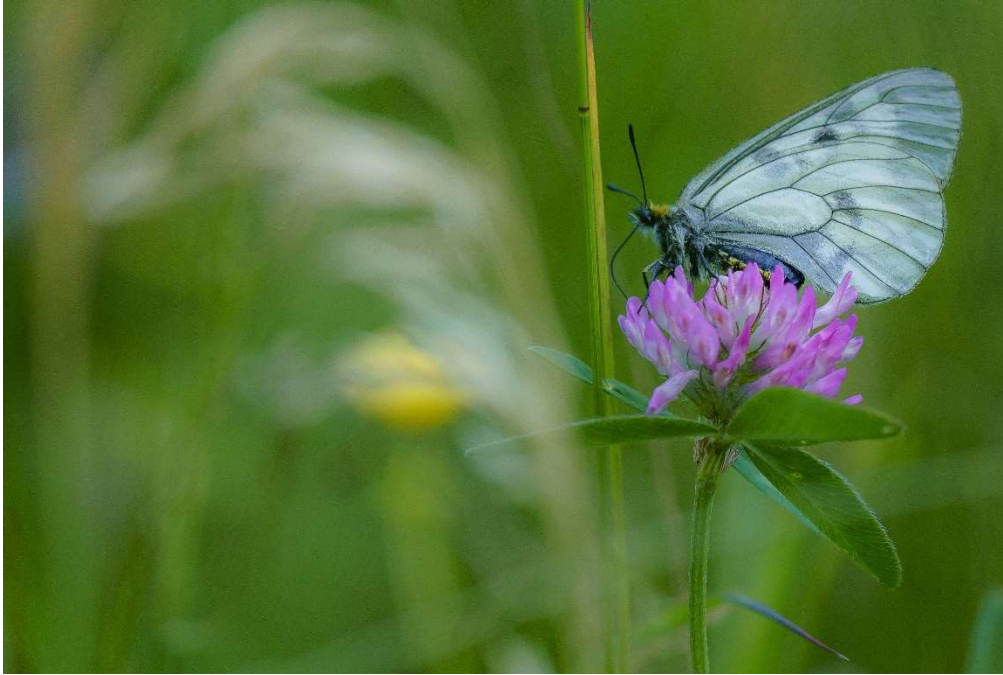
Perhosten ja muiden hyönteisten määrät ovat vähentyneet viime vuosina. Kuvassa pikkuapollo. © Arto Lehtinen