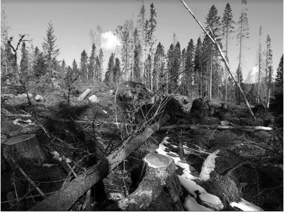
Kuva: Toimenpidealue metsänkäsittelyn jälkeen.

ja lahoavalla puulla. Niinpä luonnon monimuotoisuuden kannalta erittäin olennaisen resurssin poistamista luonnonsuojelualueelta pidetään itsestään selvästi suojeluarvoja vaarantavana toimenpiteenä.