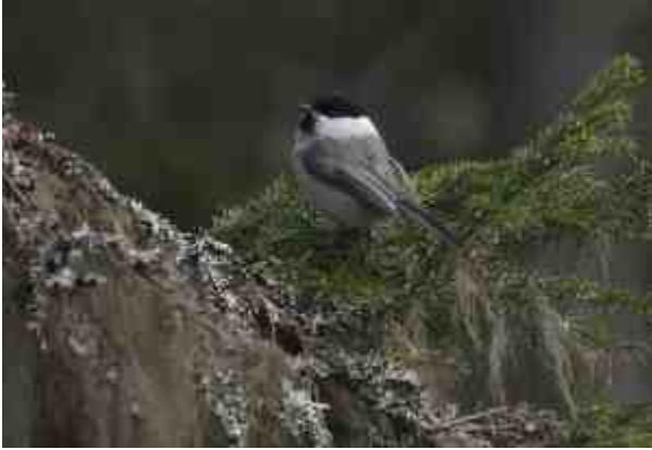
Kuva 2: Alueella pesii vaarantunut hömötiainen.

Sijaintiarvo: Vaasan yleiskaavaan on merkitty uusia asuinalueita Kylälammen pohjois- ja itäpuolelle. Kylälammelta säilyy kuitenkin yhteys Västervikin pohjoisosassa sijaitsevaan retkeilyalueeseen. Suurin osa tämän retkeilyalueen metsistä ovat yksityisomistuksessa ja Vaasan kaupungilla on vain vähäiset mahdollisuudet vaikuttaa niiden luonto- ja virkistysarvojen säilymiseen. Kylälammen itäpuoleisilla metsillä on sijaintiarvo monipuolisen metsälajiston ytimenä, josta lajeja voivat levitä ympäröiviin talous- ja virkistysmetsiin, mikäli niihin kehittyä sopivia puustorakenteita.