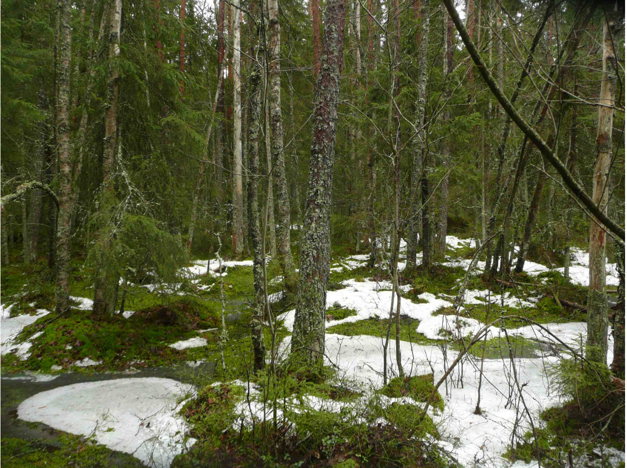
Kuva 1: Puustoltaan ja vesitaloudeltaan luonnontilainen mustikka- ja kangaskorpi alueen keskiosassa.