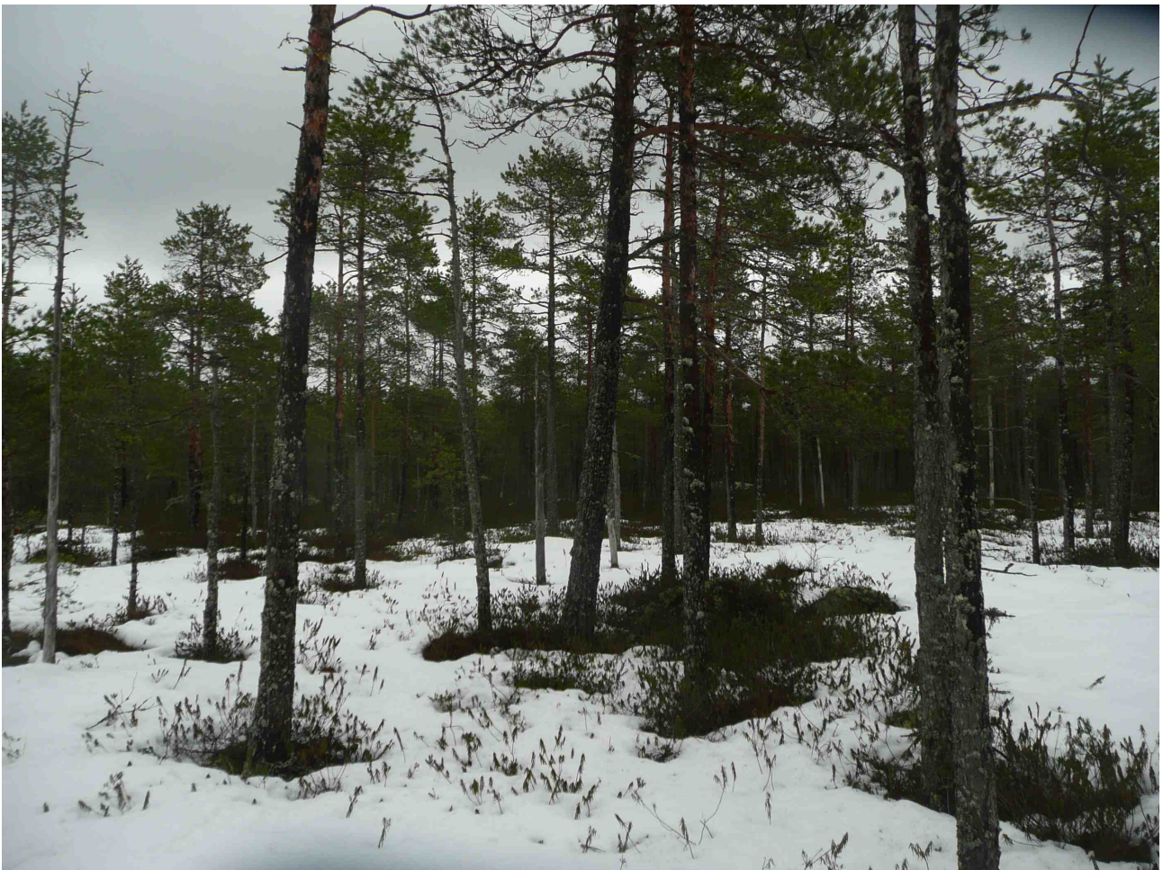
Kuva 3: Alueen pohjoisosan metsäkeidas on suoyhdistymänä luokiteltu erittäin uhanalaiseksi.

Sijaintiarvo: Vaasan yleiskaavaan on merkitty uusia asuinalueita Kylälammen pohjois- ja itäpuolelle. Kylälammelta säilyy kuitenkin yhteys Västervikin pohjoisosassa sijaitsevaan retkeilyalueeseen. Suurin osa tämän retkeilyalueen metsistä ovat yksityisomistuksessa ja Vaasan kaupungilla on vain vähäiset mahdollisuudet vaikuttaa niiden luonto- ja virkistysarvojen säilymiseen. Kylälammen itäpuoleisilla metsillä on sijaintiarvo monipuolisen metsälajiston ytimenä, josta lajeja voivat levitä ympäröiviin talous- ja virkistysmetsiin, mikäli niihin kehittyä sopivia puustorakenteita.